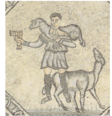
Mosaico del "Buon pastore", particolare del pavimento della Basilica di Aquileia.

La testimonianza personale, fatta di scelte resistenziali e concrete, incoraggerà i giovani a prendere decisioni impegnative, a loro volta, che investono il proprio futuro. Per aiutarli è necessaria quell'arte dell'incontro e del dialogo capace di illuminarli e accompagnarli, attraverso soprattutto quell'esemplarità dell'esistenza vissuta come